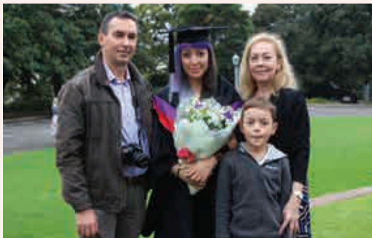
Фото автора. (Получено по электронной почте).