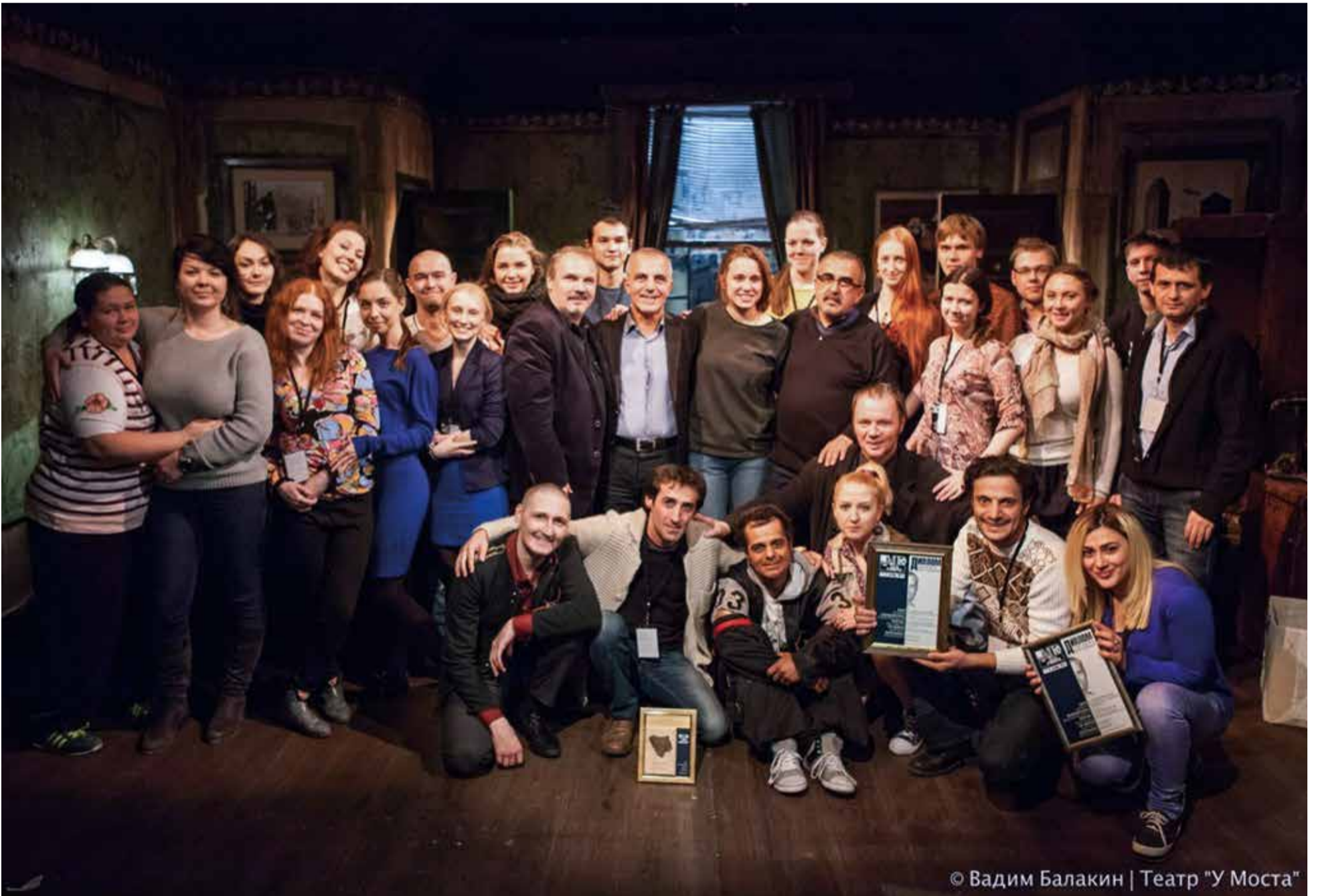
Театр "У Моста"