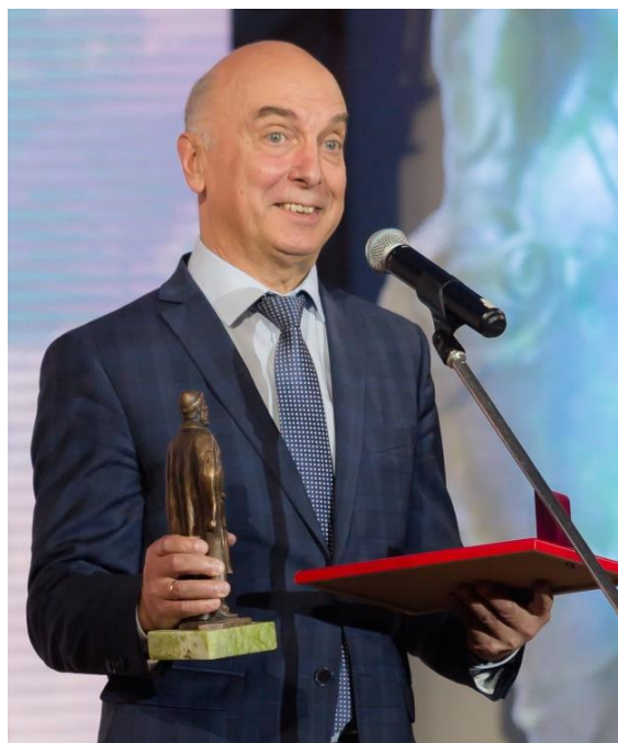
Доктор физико-математических наук, профессор, ректор ФГБОУ ВО «Пермский национальный исследовательский политехнический университет», почетный работник Высшего образования

Но для меня самое главное – это символы общественного признания, полученные от имени земляков и из рук земляков. Хочется работать дальше и приносить пользу людям Пермского края.