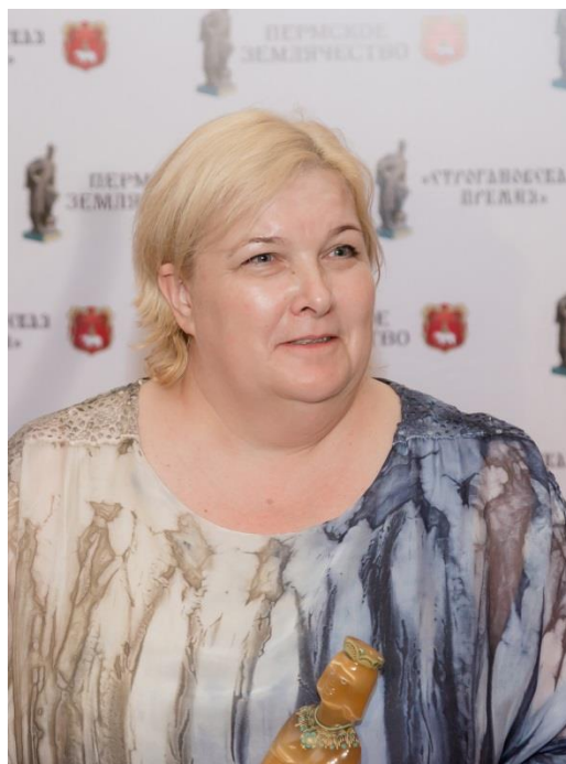
Координатор и организатор Общественного движения "Бессмертный полк"

букет - большим, а диплом увесистым. Но, главное чувство ответственности – впервые введен – специальный приз «Народное признание». За меня отдали голоса более полутора тысяч человек. И я оказалась в компании очень достойных и профессиональных людей, которые многолетним трудом заслужили звание Лауреата Стrogановской премии. Я горжусь тем, что мы стояли все вместе на одной сцене – директор колхоза, хормейстер, митрополит, учёный, спортсмен и композитор. Спасибо Пермскому землячеству за такую возможность!