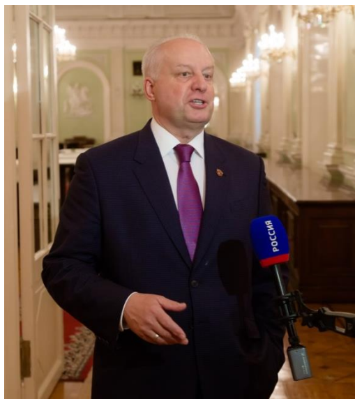
Член Правления РОО «Пермское землячество»

Каждый съезд Пермского землячества имеет свои особенности. В этом году такой особенностью был выбор площадки для проведения Съезда, которой стал - Колонный зал Дома Союзов. Считаю, что этот выбор - очень удачный! Не только потому, что это исторический объект центра Москвы, интересный с точки зрения архитектуры и эстетики, но и потому что он оснащен современной акустикой, замечательным световым оборудованием, а расположение и площадь помещений: холлов, анфилад, компактного зала позволяет организовать достойный прием участников, их общение с одновременной организацией выставок и фотосессий. Полагаю, что стоит практиковать проведение съездов землячества в Колонном зале