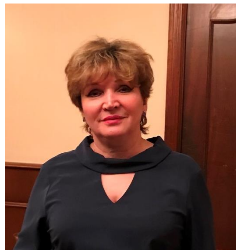
Член правления РОО «Пермское землячество», Полковник Юстиции, Заместитель председателя офицерского клуба Пермского землячества

Особо ценна, на мой взгляд, царившая на съезде атмосфера, душевности и доброты, радости и счастья от встречи с земляками.