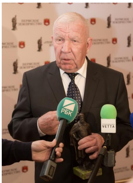
Директор ООО «Шерья» Нытвенского района, заслуженный работник сельского хозяйства Российской Федерации

13 съезд Пермского землячества в Москве это здорово! Большое спасибо Правлению землячества, что признали роль сельского хозяйства. Горжусь званием лауреата Строгановской премии. Очень рад был увидеть и познакомиться с замечательными представителями Пермского землячества. Так держать!