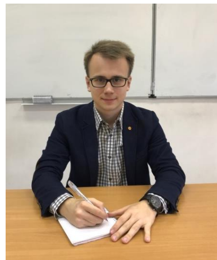
Член правления Пермского землячества, студент 2 курса экономического факультета МГУ им. М.В. Ломоносова

На съезде я присутствовал не только в качестве зрителя, но и помогал встречать гостей, а это значит, что я имел возможность лицом к лицу встретиться со многими знаменитыми пермяками. Для меня съезд был очень значим ещё и по тому, что на нем утверждали состав правления, а я был одним из кандидатов, поэтому мне хотелось быть в числе первых, кто узнает результаты обсуждения и голосования. К счастью, меня приняли в состав правления, чему я был очень рад. Если говорить в целом о мероприятии, то мне все очень понравилось. Я посмотрел выступления различных коллективов, пообщался с интересными людьми, впервые побывал в Колонном зале Дома Союзов и получил много новых, ярких впечатлений.