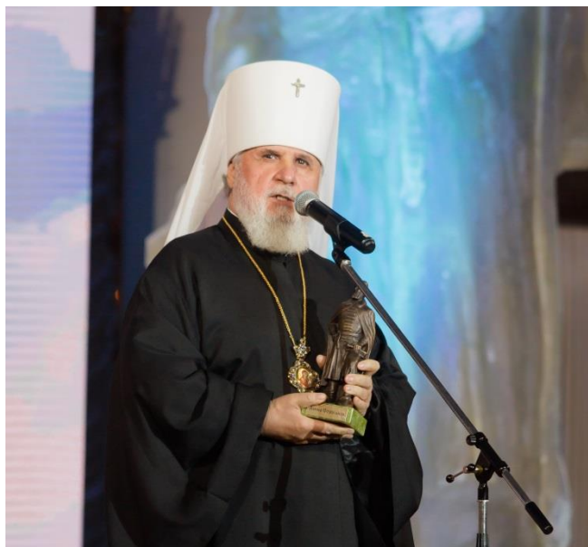
Митрополит Пермский и Кунгурский МЕФОДИЙ

Дорогие друзья! Спешу поделиться с вами своими впечатлениями от настоящего праздника, который состоялся в легендарном Колонном зале Дома Союзов г. Москвы, и участником и номинантом которого мне посчастливилось стать.