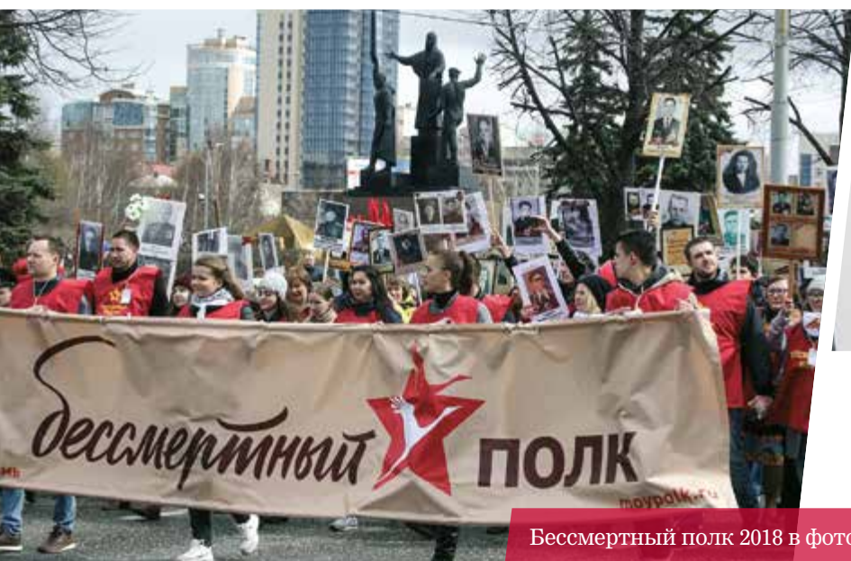
Бессмертный полк 2018 в фотографиях Валерия Заровнянних