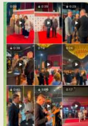
Гостей очень много! А интервью с номинантами Строгановской премии – самое интересное...