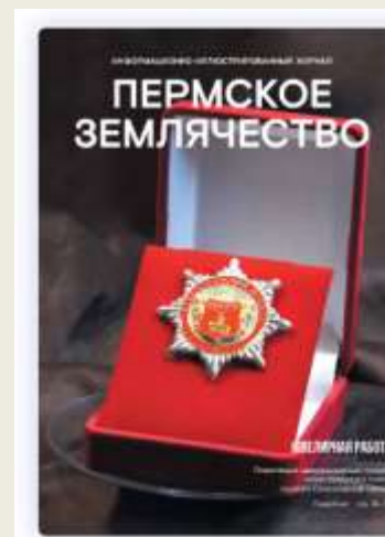
Журнал, посвященный XX Съезду Пермского землячества Скачать